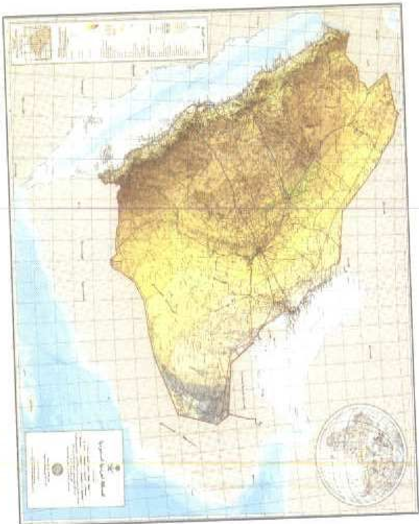
خريطة المملكة العربية السعودية صدرت هذه الخريطة من الهيئة العامة للمساحة بالمملكة العربية السعودية الطبعة الثالثة ١٤٣٠ هـ - ٢٠٠٩ م رقم الإيداع بمكتبة الملك فهد الوطنية ٣٨٢٦ / ١٤٣٠ هـ ردمك : ٨٠١٥ - ٦٠٣ - ٩٧٨